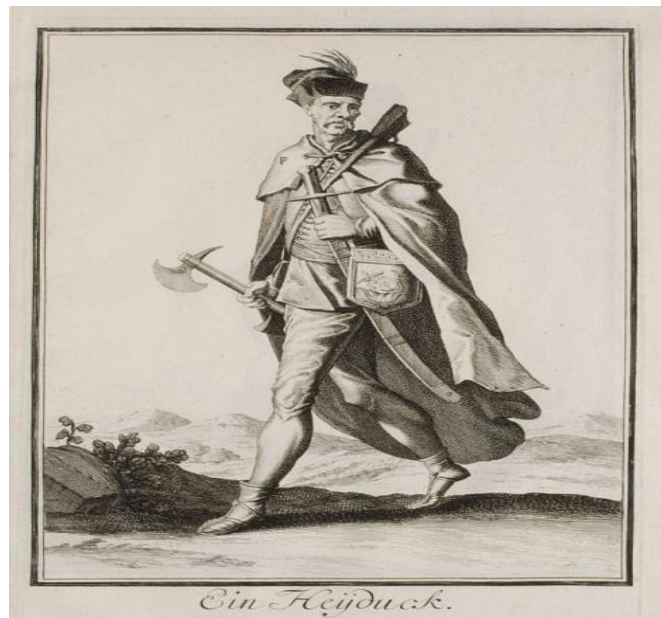
Obrázok č. 2: Maďarský hajduch 1703. 26

Názvom hajdúch označovali od 16. storočia pastierov rožného dobytku. Uhorsko bolo v 16.–17. storočí najväčším exportérom hovädzieho mäsa v Európe. Dobytok sa hnal po celej Európe do Ausburgu, Mníchova a Benátok. Počet vyváženého dobytku bol obrovský, počítal sa na desiatky tisíc kusov. 24 Tieto stáda hnali a chránili pastieri, ktorí napriek uhorským zákonom, ktoré pre „nižšie stavy“ zakazovali nosenie zbraní, boli ozbrojení. 25 Ozbrojili ich samotní majitelia stád, aby ubránili zverený statok. V druhej polovici 16. storočia, kvôli okupácii Turkov určitých častí Uhorska, chov a vývoz dobytku v značnej miere začal stagnovať a tak pastieri stratili svoje živobytie. Svoje uplatnenie našli aj ako žoldnieri a od roku 1550 je už označenie hajdúch synonymom vojaka.