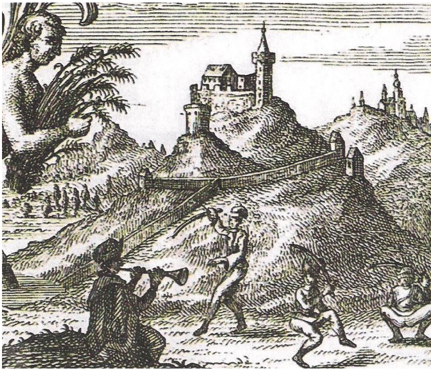
Obrázok č. 8: S. Mikovíny: 7 Detail z rytiny „Novohrad“ 1736. 43