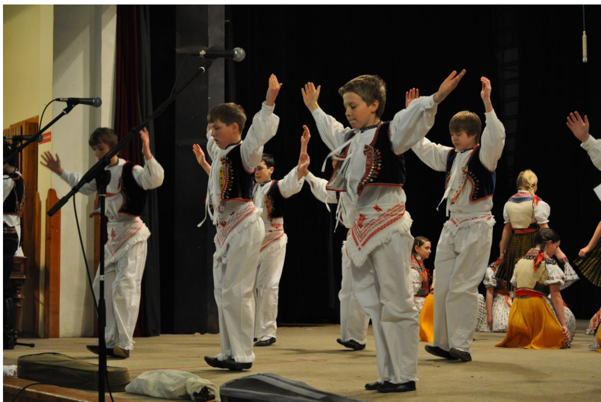
Chlapci ze souboru Veličánek z Velké nad Veličkou v pásnu Vandrováli hudci na festivalu Mladé Horňácko. 63

V současné době je na rozdíl od sedlácké, která je samovolně tančena lidmi (nejen členy souboru) na oslavách, narozeninách, besedách u cimbálu a při fašankové obchůzce odzemek již jen záležitostí pódiovou. Mají jej ve svém repertoáru dětské folklorní soubory Veličánek a Lipovjánek a u jiných dětských souborů se objevují odzemkové figury ojediněle ve scénických pásmech (s tématy na pastvě, chlapecké hry, Vánoce apod.).