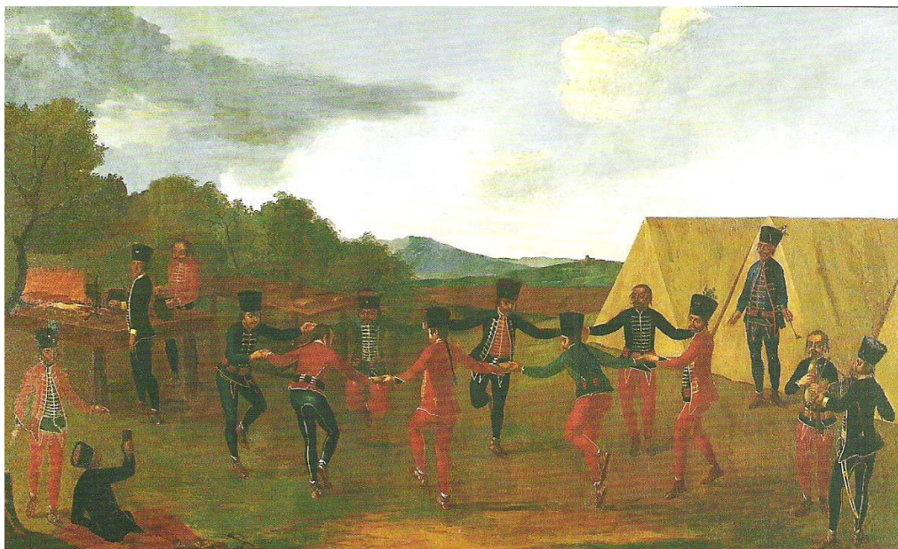
Obrázok č. 10: Anonym: Tancujúci vojaci okolo 1760–70. 45