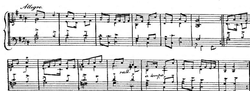
Melodia tańca z r. 1541, zwanego „Hajduk,” przełożona z tabulatury organowej tamtoczesnej przez Al. Polińskiego; harmonje oryginalne.

Hajduk rozpowszechniony i popularny musiał być na ziemiach Rzeczypospolitej już wcześniej, gdyż z 1541 roku pochodzi pierwszy zapis melodii tańca, zawarty w tabulaturze organowej Jana z Lublina, z której transkrypcja przytoczona jest w Encyklopedii Staropolskiej :