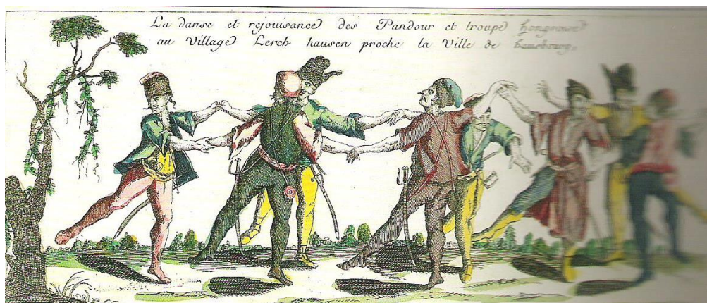
Obrázok č. 12: Anonym: Tanec maďarských vojakov a strážnikov. 47