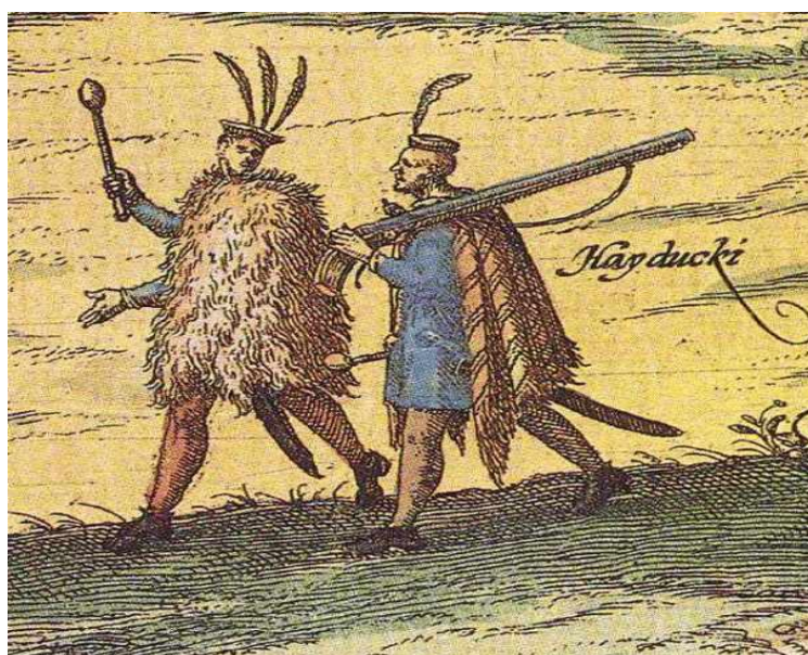
Obrázok č. 4: Hajdúsi – úryvok z vyhlídky mesta Győr, 1597–1598. 28

Od tej doby sa rozoznali dve skupiny hajdúchov, kráľovskí a slobodní. Kým prví slúžili na hraniciach Uhorska a tvorili posádky protitureckých pevností, druhá skupina sa príležitostne nechávala najat' na vojnovú výpravu, často sa však živili lúpením.