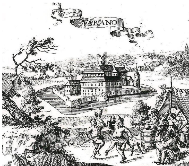
Obrázok č. 7: Justus van der Nypoort: Varano 1686. 42