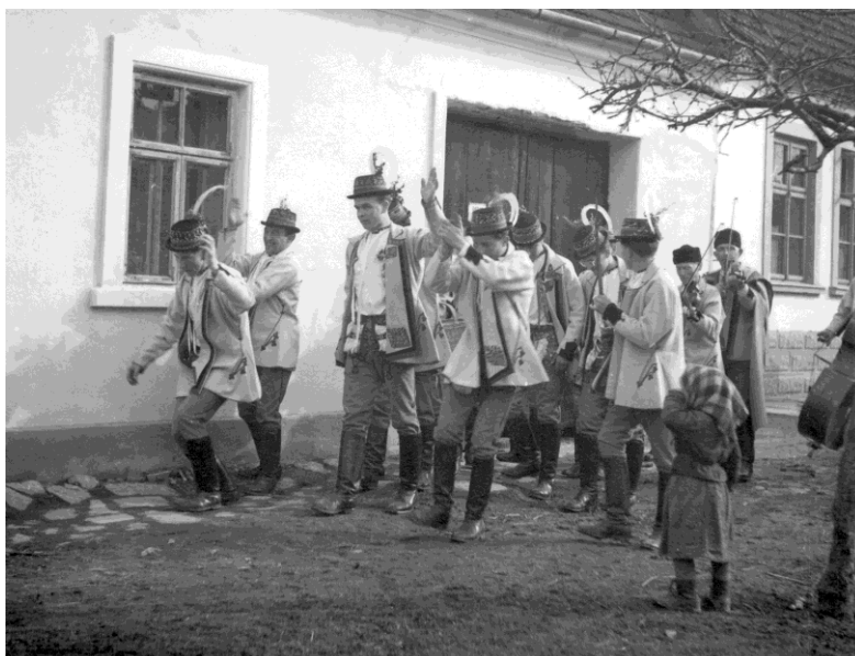
Muži z Velké nad Veličku při fašankové obchůzce. 57

Nejrozšířenějším mužským tancem je na Hornácku verbuňk . Je nejmladšího původu a lze jej sledovat v této oblasti od konce 19. století, kdy jej např. sběratel Martin Zeman (1854 – 1919) zmiňuje v katalogu Národopisné výstavy československé. Ve srovnání s verbuňkem z jiných slováckých oblastí je ten hornácký charakteristický drobnějšími ciframi, menšími, ne příliš četnými, skoky, jemnější kresbou chodidel a celkovou sevřeností pohybu. Pohybově vychází z tanečních prvků objevujících se při sedlácké, při fašankových obchůzkách, svatebních průvodech apod. Je založen na improvizčních schopnostech tanečníků a jejich tvůrčím talentu tvořit choreografii tance přímo během jeho provádění.