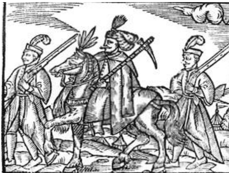
Obrázok č. 3: Poľskí hajdúsi v národnom odeve. 27

Od tej doby sa rozoznali dve skupiny hajdúchov, kráľovskí a slobodní. Kým prví slúžili na hraniciach Uhorska a tvorili posádky protitureckých pevností, druhá skupina sa príležitostne nechávala najat' na vojnovú výpravu, často sa však živili lúpením.