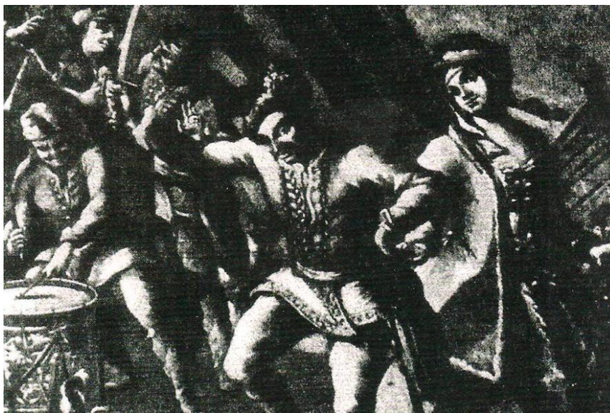
Obrázok č. 9: Anonym: Tancujúci kurucký dôstojník 18. str. 44