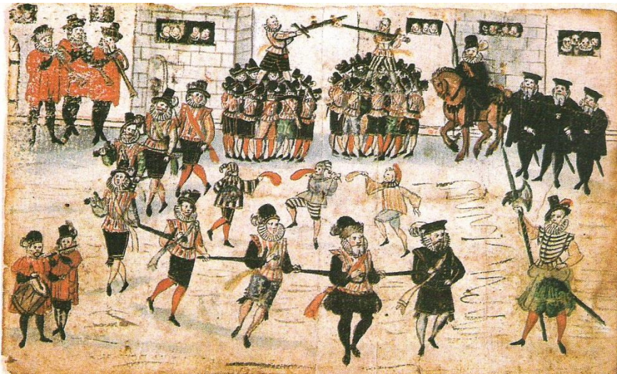
Obrázok č. 1: Kolorovaná kresba z Kremnice, 17. str. 22

„Bojové“, resp. „zbrojné“ tance, ktoré sa vyskytujú v tanečných kultúrach takmer na celom svete, siahajú do prehistorických období a u takmer všetkých európskych národov tvoria akýsi prazáklad tancov. Zmienky o nich existujú z antického obdobia i zo stredoveku. 20 V širšom ponímaní „zbrojnými“ tancami nazývame všetky tance, ktoré sa tancovali so zbraňou (šabl'a, valaška, sekera, palica), resp. tie tance, v ktorých v súčasnosti používaný predmet (pohár, steblo slamy) nahradil zbraň. V Európe sa uchovalo niekoľko typov „zbrojných“ tancov, napr. „palicové“, resp. „cechové“ tance, kde šabl'a, nôž a palica slúžili na prepojenie tanečníkov, ako aj moreska, na našom území v roku 1650 zakázaná, no napr. na ostrove Korčula 21 známa dodnes. Sú všeobecne známe aj tance Škótov nad dvoma šabl'ami, turecké, grécke a albánske tance s nožmi.