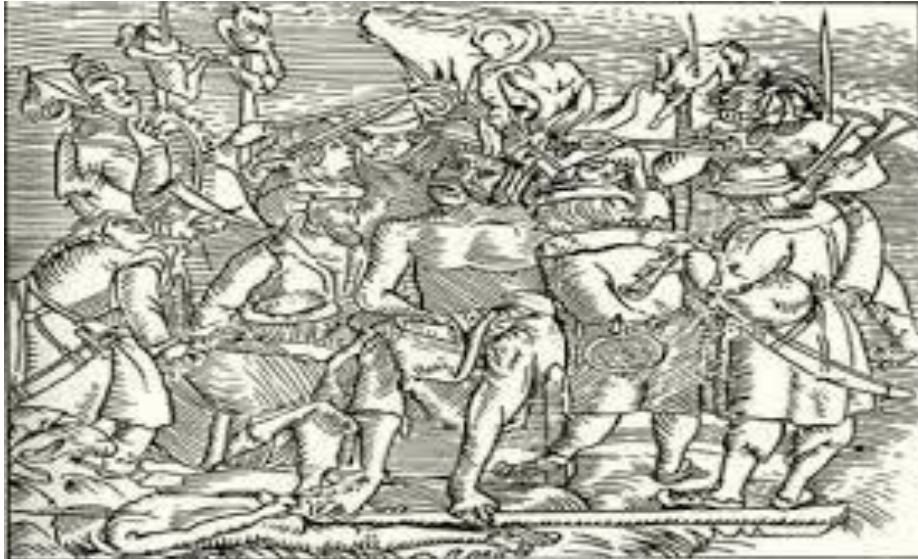
Obrázok č. 5: Poprava Gy. Dózsú r. 1514, súdobá rytina. 32