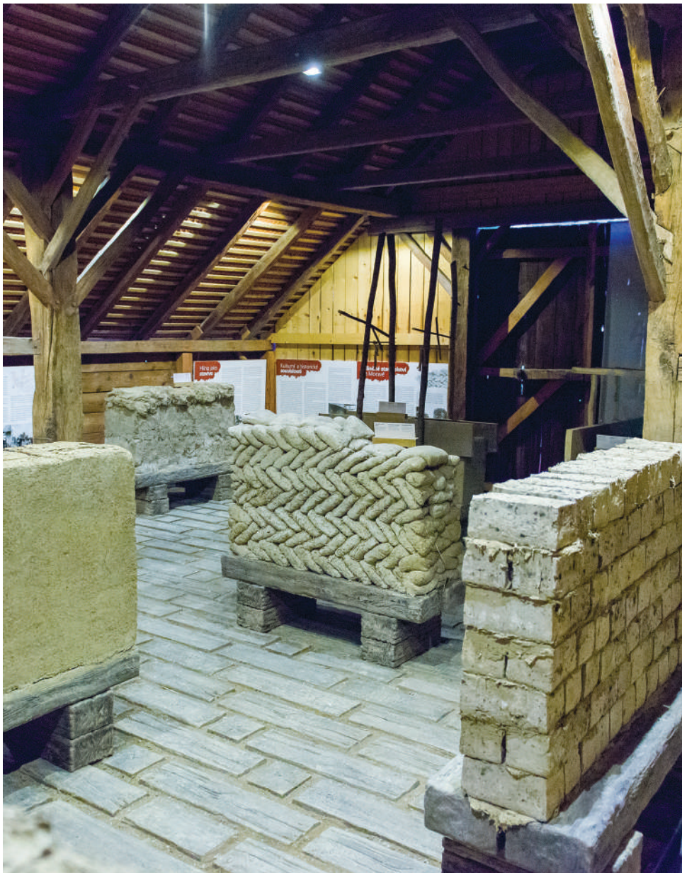
Земљана архитектура Моравије, детаљ изложбе