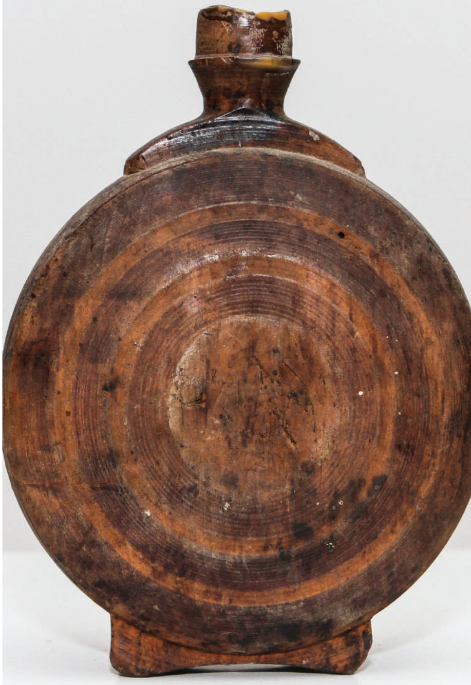
Чутура из збирке Музеја „Старо село“ (инв.бр. 241) /

The cask from collections of "Old Village" Museum (inv. No.241)