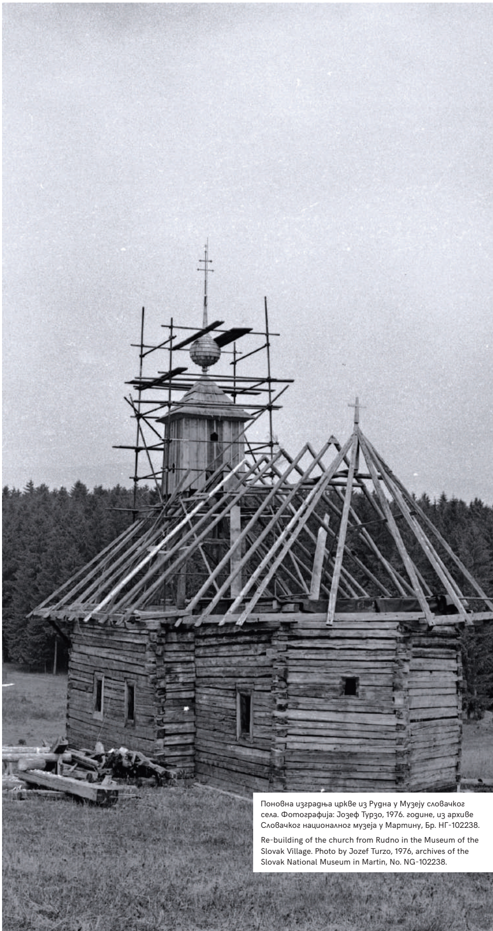
Поновна изградња цркве из Рудна у Музеју словачког села. Фотографија: Јозеф Турзо, 1976. године, из архиве Словачког националног музеја у Мартину, Бр. НГ-102238.

Re-building of the church from Rudno in the Museum of the Slovak Village. Photo by Jozef Turzo, 1976, archives of the Slovak National Museum in Martin, No. NG-102238.