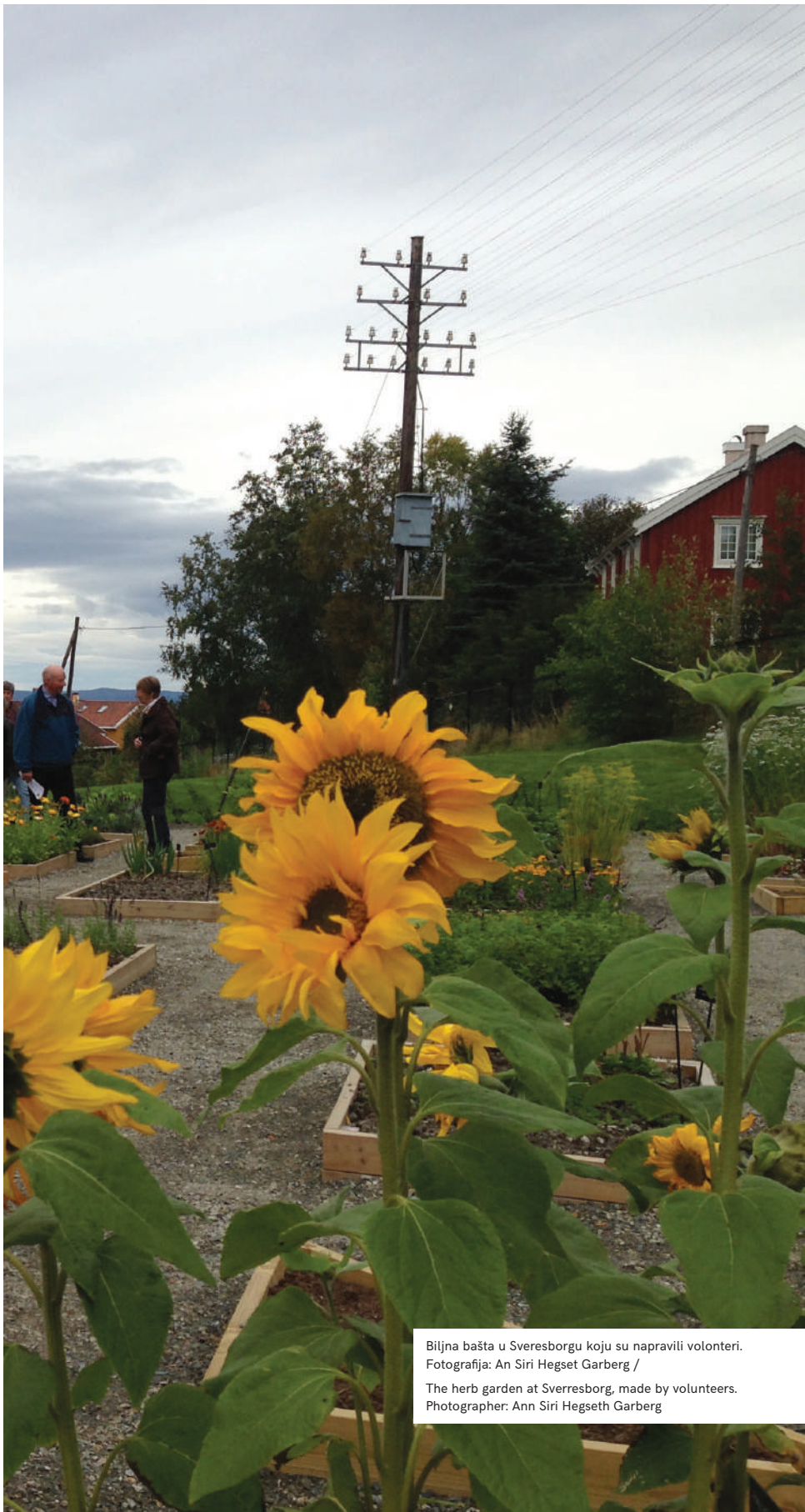
Biljna bašta u Sverresborgu koju su napravili volonteri. The herb garden at Sverresborg, made by volunteers.