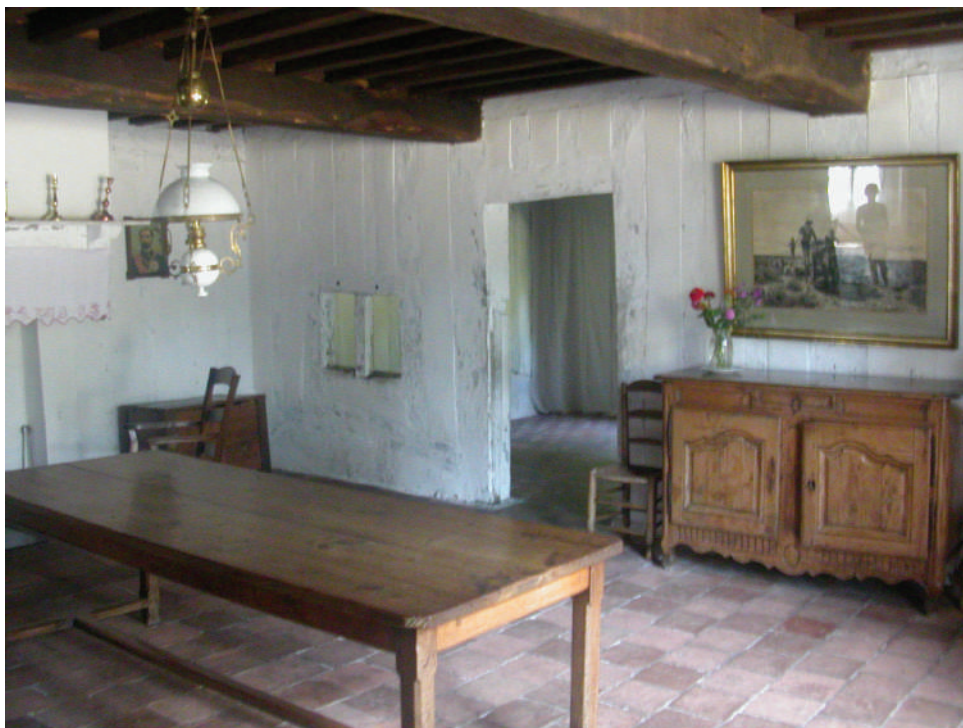
Ентеријер куће у еко-музеју де ла Гранд Ланд, Сабр, Француска / Domestic interior at the Ecomusée de la Grande Lande, Sabres, France