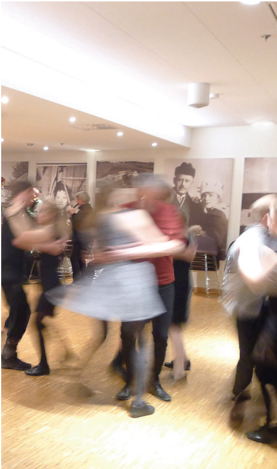
Ринаве музички музеј, Трондхајм, Норвешка Ringve Music museum, Trondheim, Norway