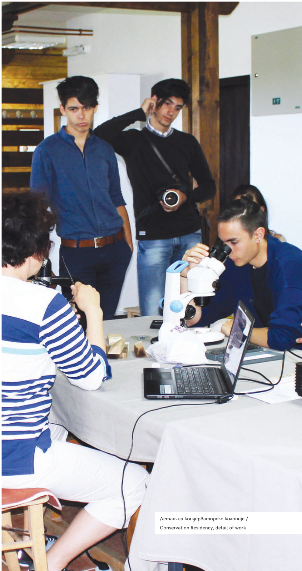
Детаљ са конзерваторске колоније / Conservation Residency, detail of work