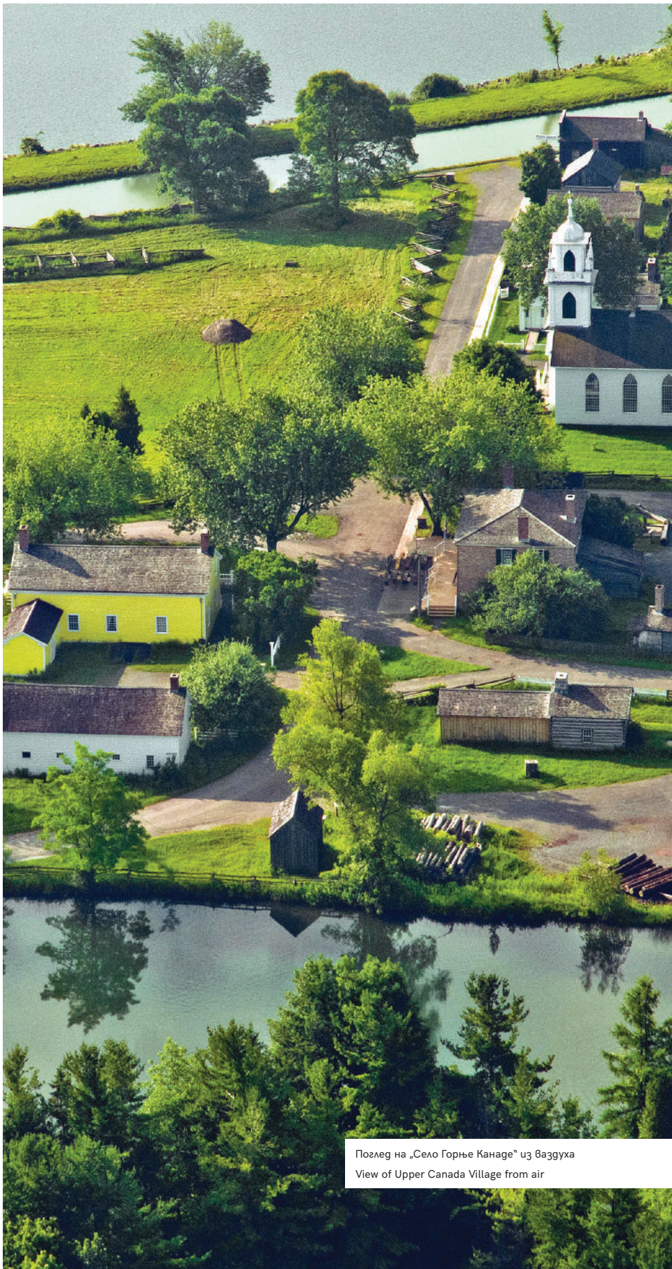
Поглед на „Село Горње Канаге“ из ваздуха View of Upper Canada Village from air