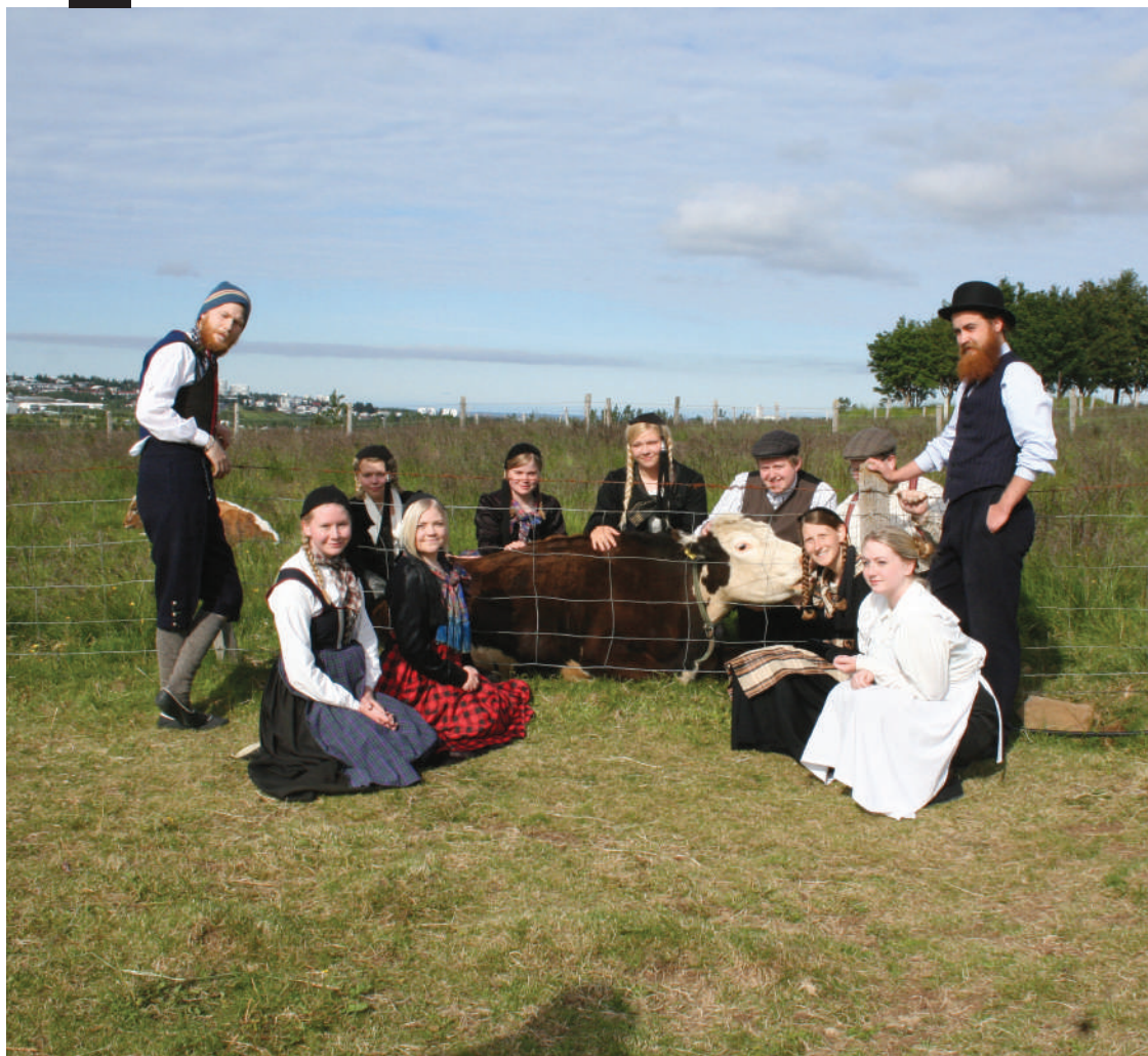
Музејско особље у костимима Museum staff in costumes