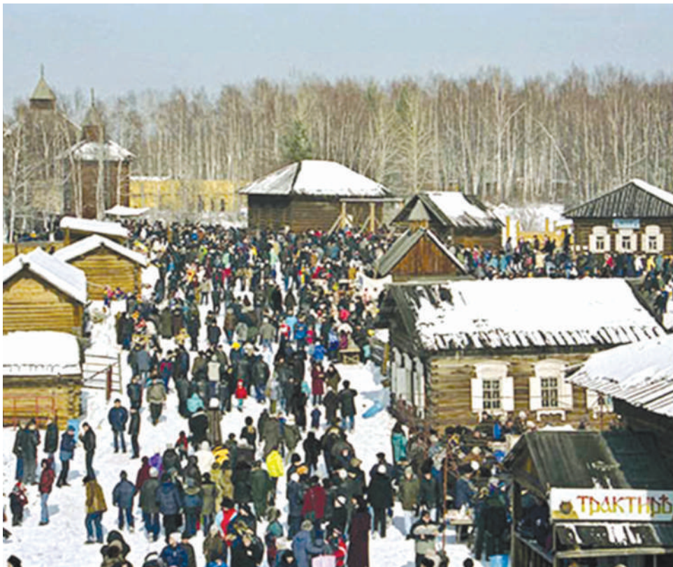
Ethnographic open air museum Tal'tsi, Russia, detail Етнографски музеј на отвореном Талци, Русија, детаљ