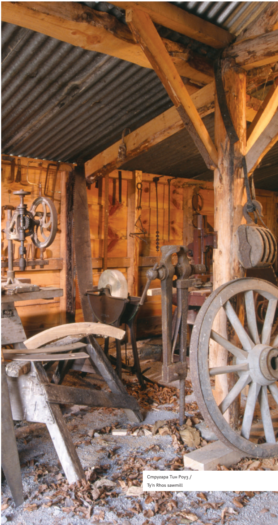
Стругара Тун Роуз / Tu'n Rhos sawmill