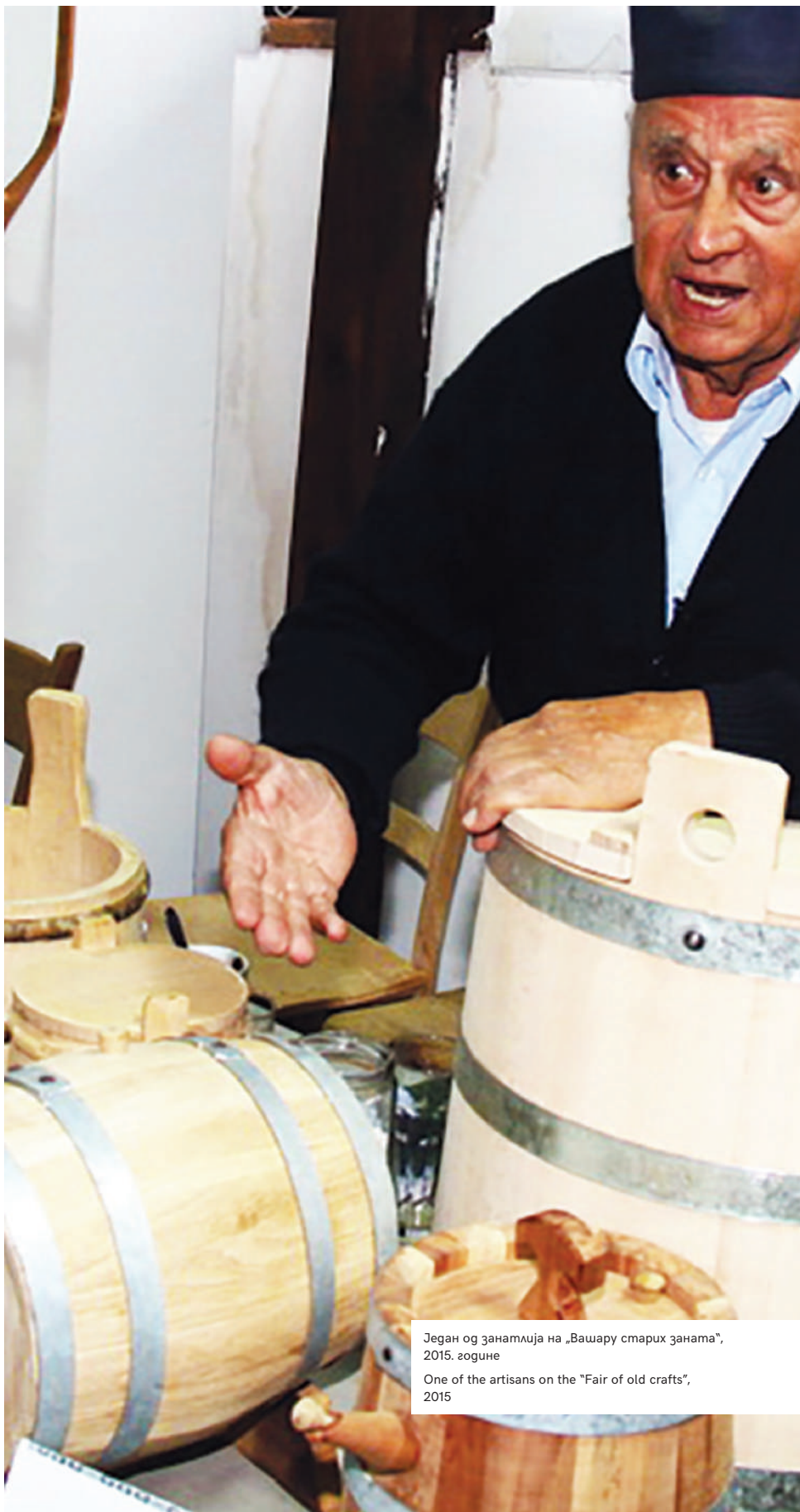
Један од занатлија на „Вашару старих заната“, 2015. године

One of the artisans on the "Fair of old crafts", 2015