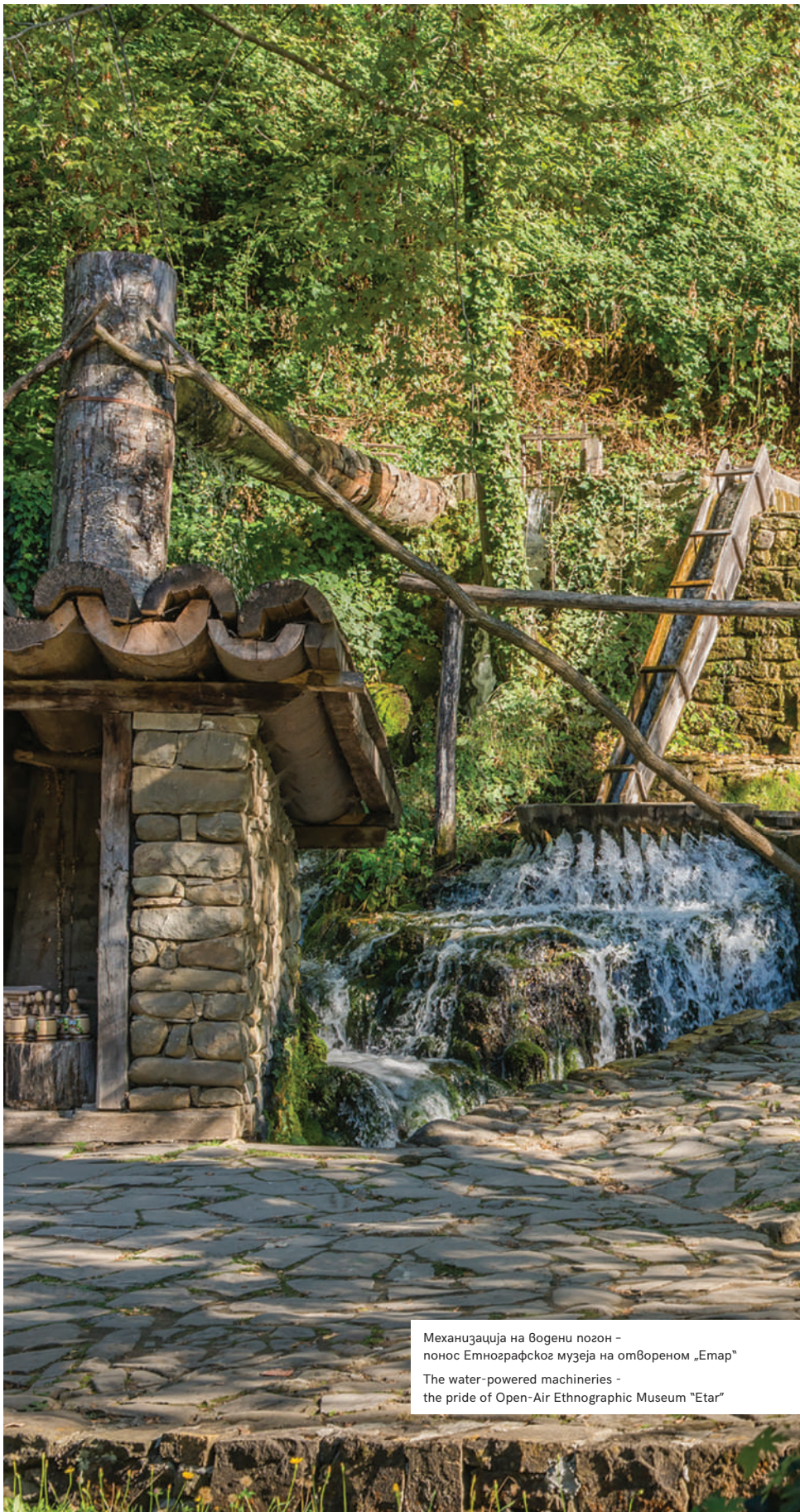
Механизација на водени погон – понос Етнографског музеја на отвореном „Етар“ The water-powered machineries - the pride of Open-Air Ethnographic Museum "Etar"