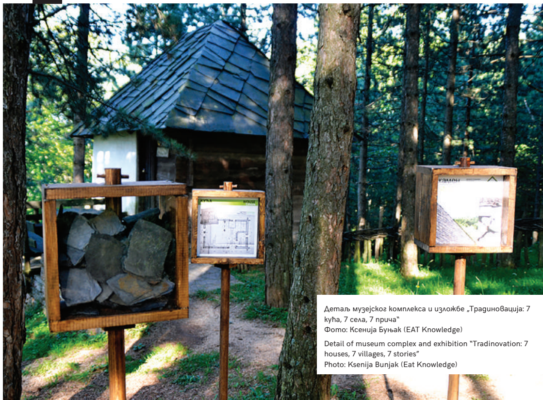
Деталј музејског комплекса и изложбе „Традиновација: 7 кућа, 7 села, 7 прича“