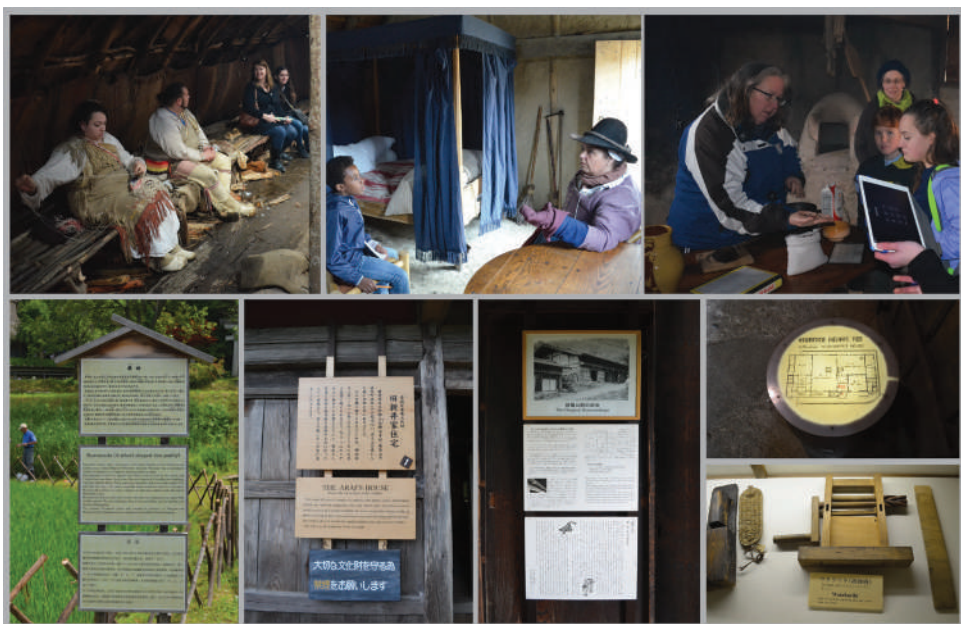
Два различита начина да се информису посетуици: Плимут плантаже (горе) и Хига народно село (голе)

Two different ways to inform visitors: Plimoth Plantation (row above) and Hida folk village (row below)