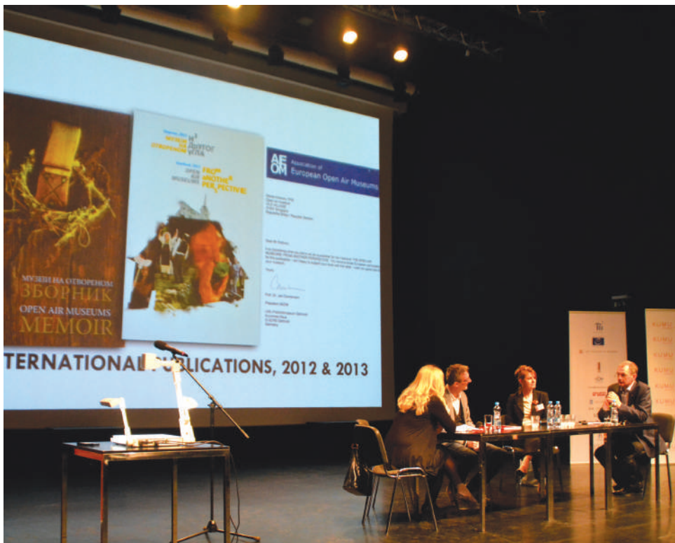
Презентовање Музеја на отвореном „Старо село”, Награда за европски музеј године (ЕМЈА), Талин, 2014 (Re)presenting the Open air museum “Old Village”, European Museum of the Year Award (EMYA), Tallinn, 2014