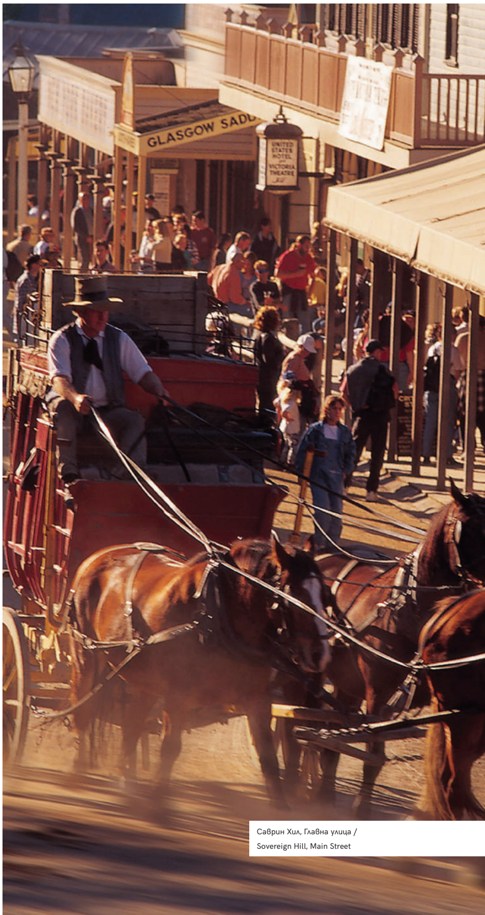
Саврин Хил, Главна улица / Sovereign Hill, Main Street