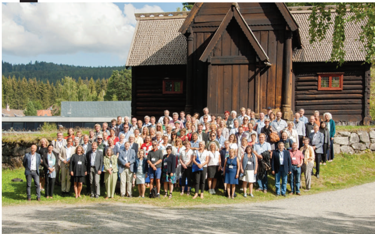
АЕОМ - лидери музеја из 23 земље окупљени у Норвешкој. у Мејхагену, 24.август 2015.године.