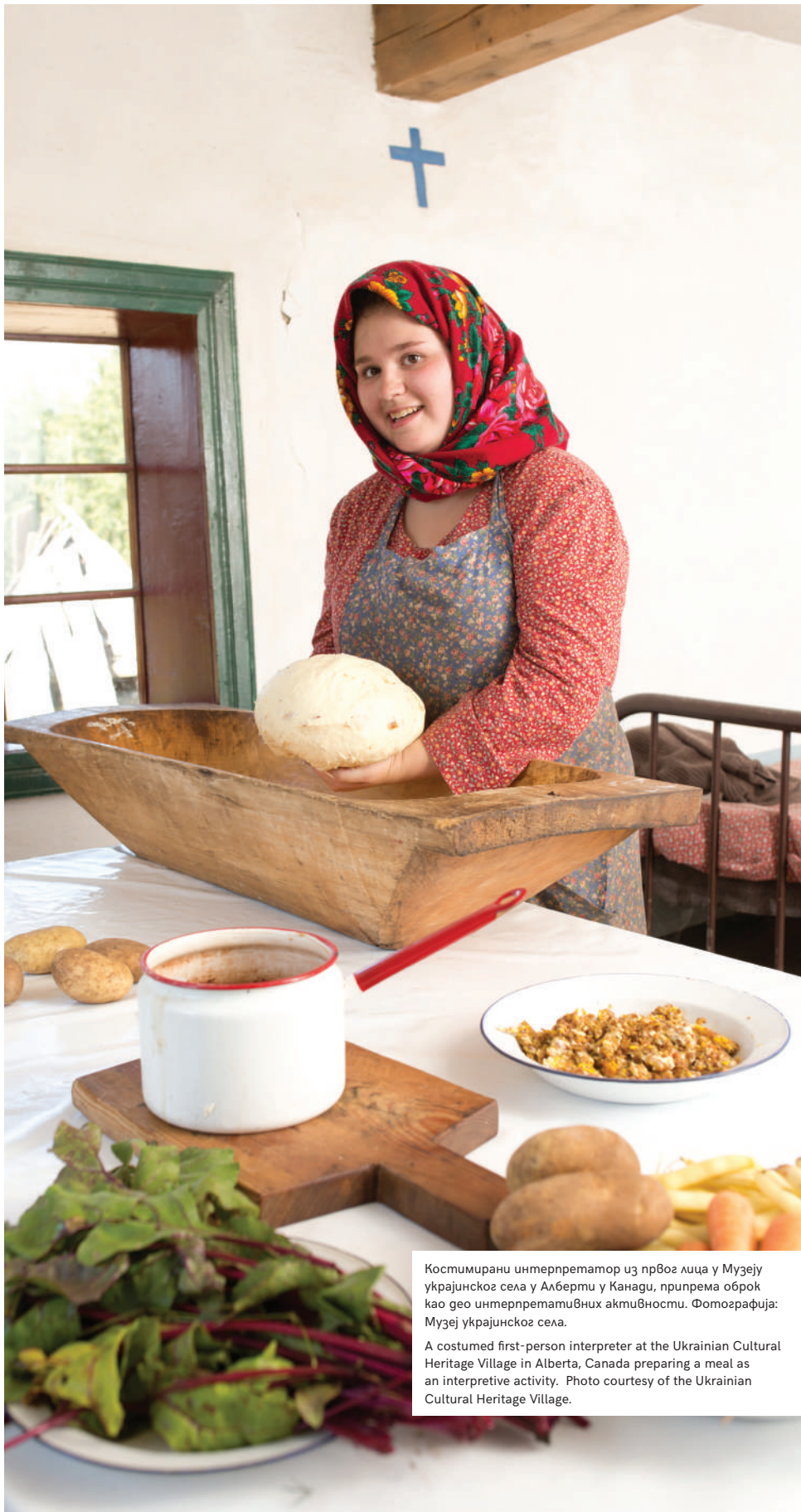
Костимирани интерпретатор из првог лица у Музеју украјинског села у Алберти у Канади, припрема оброк као гео интерпретативних активности.