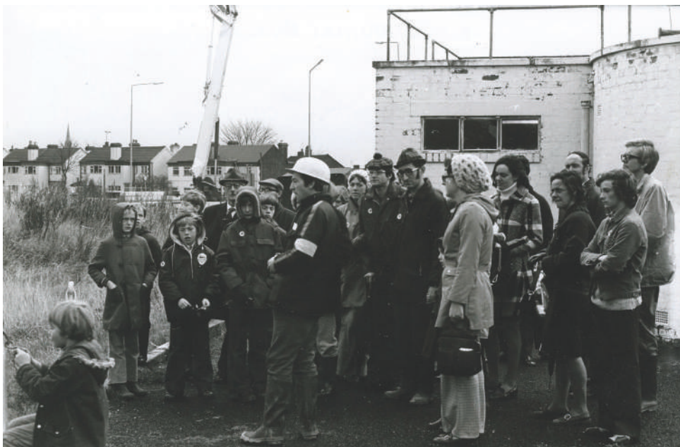
Отворени дан у Живом музеју Блек кантри (Црна земља), 1974.

Open Day at the Black Country Living Museum, 1974