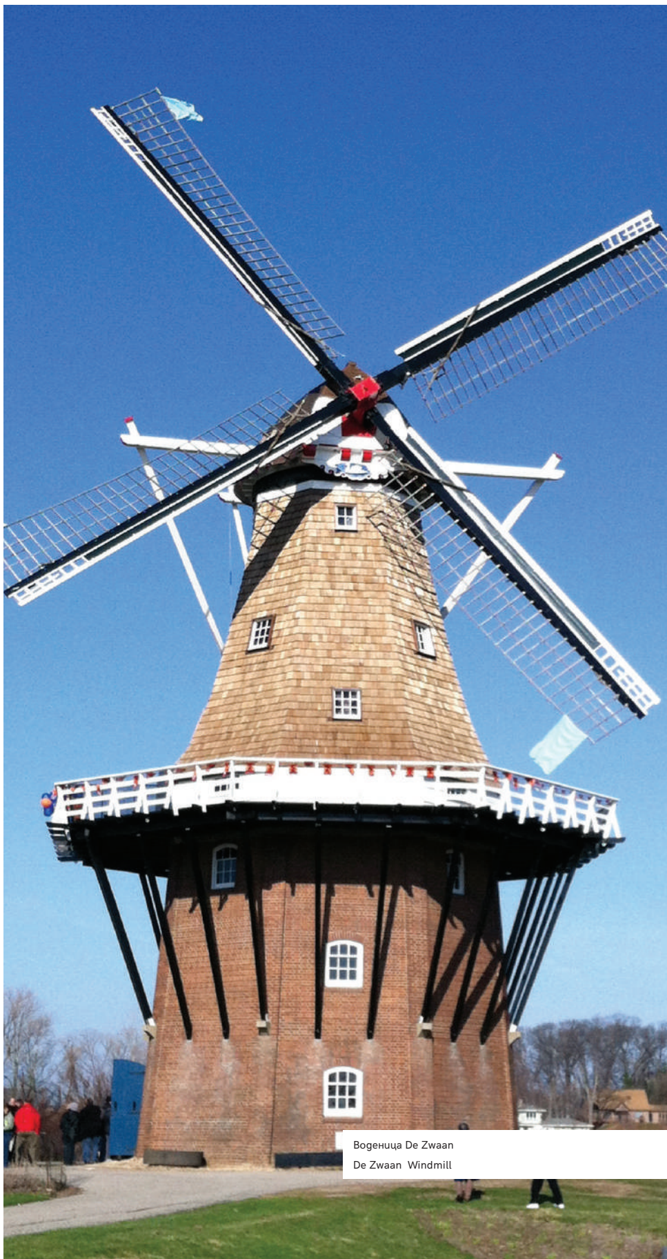
Вогеница De Zwaan De Zwaan Windmill