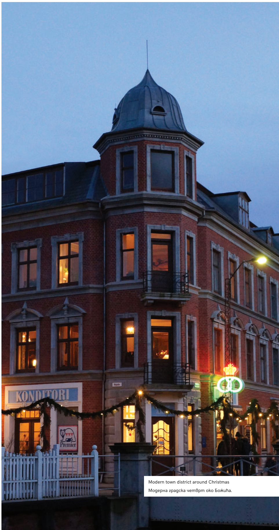
Modern town district around Christmas Модерна градска четврт око Божића.