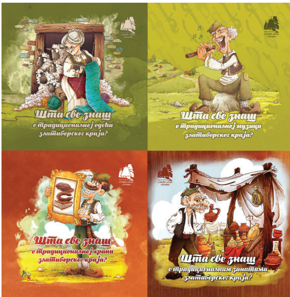
Насловне стране сликовница „Шта све знаш о...?“ Cover pages of picture books “What do you know about...?”